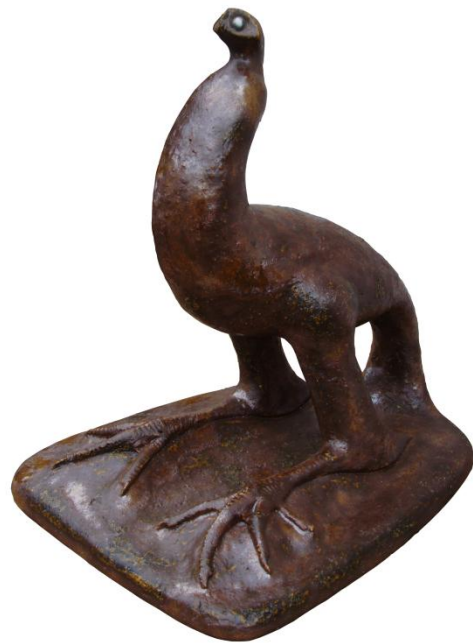
<UN OISEAU AUTREFOIS – 1971>

Une œuvre nous rapproche d'avantage techniquement par l'emploi de moulage de pattes de poule. En effet le catalogue de la vente Camard présente au lot n° 141 une œuvre intitulée <<Coupe patte de poulet>> créée en 1988 en apparence, dont la technique du moulage de la patte fut utilisée d'après le descriptif. De la même manière je créais bien avant en 1971 une œuvre surréaliste intitulée <<Un oiseau autrefois>> où j'employais également le moulage de deux véritables pattes de poulet.