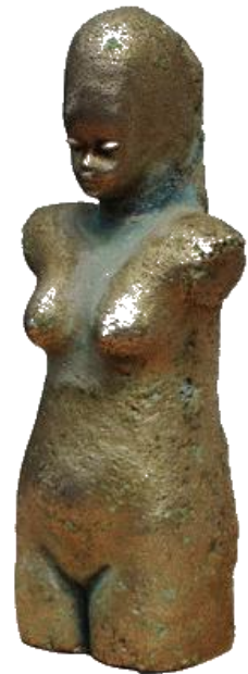
<EVA NICKEL – 1976>

Envahi par ce désir de création et de renouveau, grâce à ma double action de plasticien et de céramiste, j'ai créé d'autres manières d'aborder le travail de la terre en volume et matière. Le procédé de crépi brut ( new brutalism ) tout en étant lissé, constellé de crevasses inégales des formes modelés, était une façon inédite d'appréhender la texture des œuvres qui étaient ensuite émaillé sur cru. Mes recherches m'ont aussi amené à découvrir un revêtement improbable, complexe et surtout novateur en la matière décorative de la céramique (le nickel) . J'ai ainsi réalisé quelques œuvres prototypes, traitées par ce revêtement nouveau, dont <Eva Nickel>.