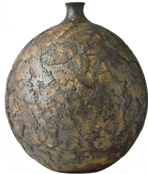
Vase boule design modelé en terre réfractaire émaillée sur cru (mono cuisson). Décor de crêpi (new brutalism). Hauteur 31 cm (1974 /1975). Collection du GRASSI MUSEUM.